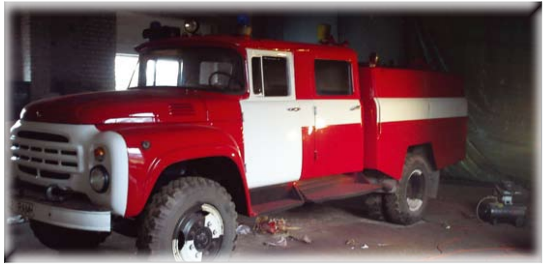
MTÜ Purtse Vabatahtlik Pääste on kätte saanud oma esimese päästeauto, mis on kenasti värvitud ning läheb kohe päästekeskusesse komplekteerimisele.

Poolteist aastat tagasi loodi koos Purtse ja Liimala kogukonnaga MTÜ Purtse Vabatahtliku Merepääste, millesse loodeti koondada kõik päästealad. Siis selgus aga, et kahte asja - päästet merel ja siseveekogudel - ühendada ei saa, kuna Eestis on viimane päästeteeni ning esimene politsei- ja piirivalveteeni rida. Nii loodigi juurde MTÜ Purtse Vabatahtlik Pääste, mille vastutusalas-