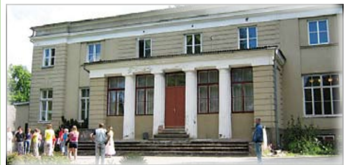
Vana-Kuuste mõisakool, kuhu laste kõrvale mahub tegutseda ka külaselts.

Lisaks pakkusid soomlased välja idee, et eestlased võiksid enam pakkuda ka põllumajandusturismi, mis on Soomes väga levinud: inimesed maksavad võimaluse eest korjata korvitaids maasikaid.