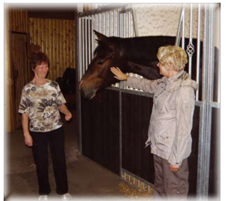
Kukrumäe ratsatalu aitab lapsed liikuma.

Ekskursiooni teine päev algas Kurtna mootorrattamuseumis, kuhu on kokku kogutud mootorrattaste ajalugu alates eksponaatidest, mis on väga vanad ja maa seest välja kaevatud, kuni asjadeni, mida keskealised mäletavad oma nooruspõlvest. "Seal olid olemas nii