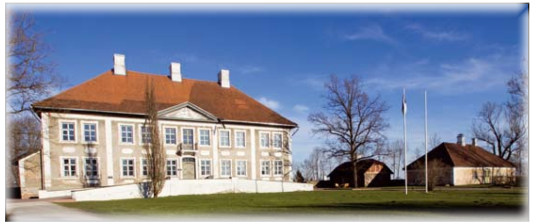
Maidla mõisa juurde luuakse Virumaa koostöökogu toel infopunkt, kus jagatakse infot kogu piirkonna kohta.

Maidla Mõisa Arendus sisustab toetuse eest oma