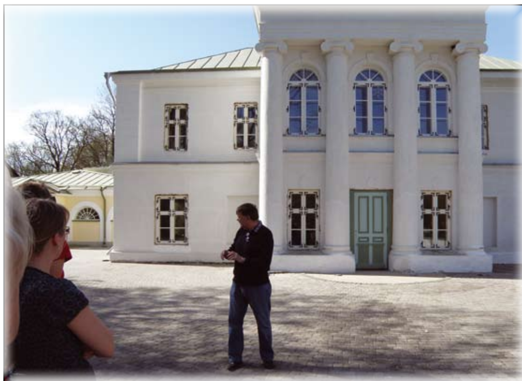
Kumna mõis on saanud toetusi erinevatest projektidest ning on osaliselt renoveeritud, osaliselt mitte.

Ilvese sõnul on Virumaa koostöökogu ka edaspidi valmis sarnased reise teistesse tegevusgruppidesse ette võtma: "Ootame selles osas liikmetelt aktiivseid ettepanekuid, millised piirkonnad võiksid huvi pakuda."