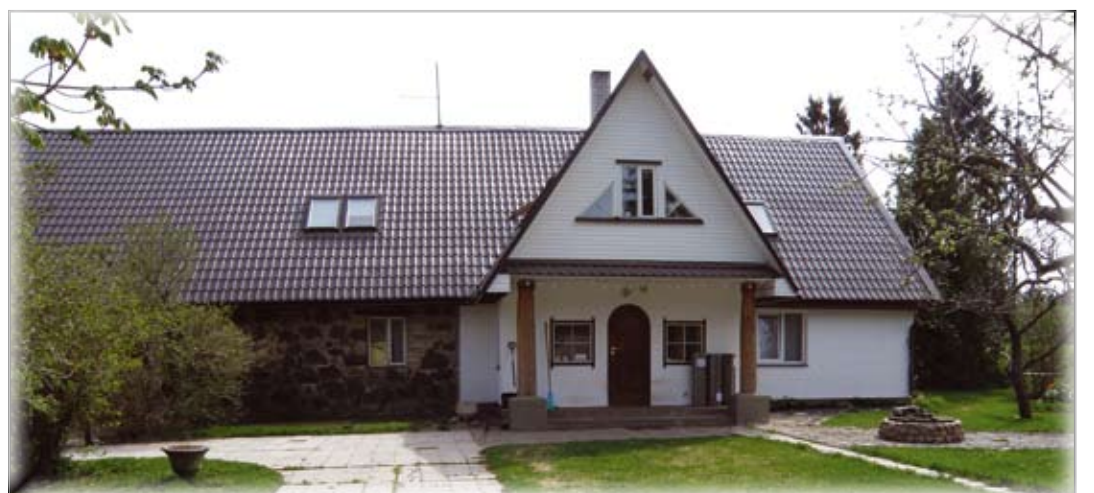
Esko talus satub inimene teleseriaali - siin filmitakse kodumaist seepi "Õnne 13".