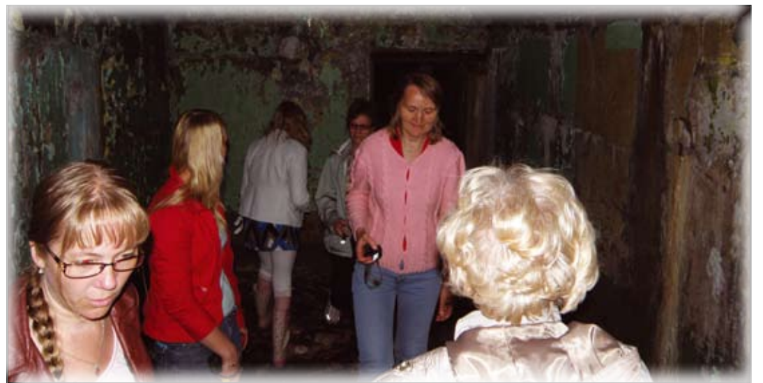
Peeter Suure merekindlus on üks mõjusamaid militaarobjekte, mis viib külastajad maa-alusesse maailma.

Vääna külakojas sõi reisiseltskond lõunat ning vaatas üle Nelja Valla Kogu kontori. Külakoda täidab ka seltsimaja ülesannet: seal käib koos käsitööselt, on väike laste loovuskool, seal on olemas kangasteljed. Külamaja õuel asub jahimajak, kus on olemas kõik, mida jahimeestel pärast jahti vaja läheb. "Seal tegeletakse pärast jahti loomakeredega, küpsetatakse maksa, käiakse saunas ning vajadusel saab